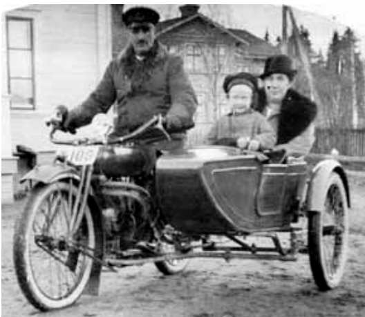
(Personerna på bilden är inte samma som i texten, men visar en Indian motorcykel med sidovagn.)

Efter kriget började mor och far samt jag att åka på motorsport som hette Sckramler, det vi i dag kallar Motor-Cross.