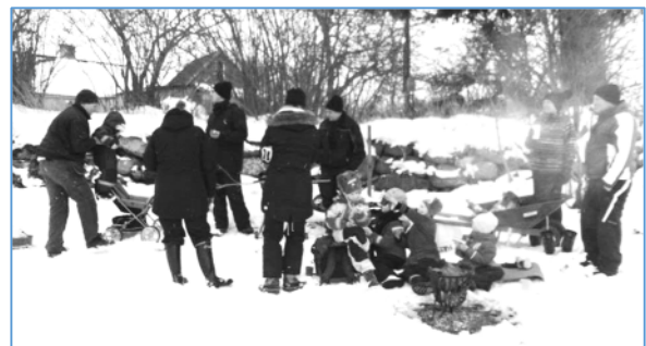
Grillning efter åkningen