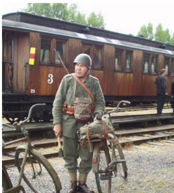
(Beredskapssoldat, någonstans i Sverige)